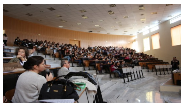
Το πρόγραμμα "COMMUNAID" παρουσιάστηκε κατά τη διάρκεια ημερίδας για τη βία κατά των γυναικών, που οργανώθηκε από το Εργαστήριο Μελέτης Συμπεριφορών Υγείας και Οδικής Ασφάλειας LaHeRS στο ΤΕΙ Κρήτης στις 25 Νοεμβρίου 2013. Κατά προσέγγιση 450 φοιτητές της τριτοβάθμιας εκπαίδευσης παρακολούθησαν την ημερίδα.

δ) να δημιουργηθεί ένα χαρτοφυλάκιο των κοινοτικών πόρων και των συμμάχων για μετανάστριες οικιακές βοηθούς θύματα σεξουαλικής βίας. Το χαρτοφυλάκιο με τις κοινοτικές πηγές των χωρών που συμμετέχουν στο πρόγραμμα είναι προσβάσιμο μέσα από την ηλεκτρονική σελίδα του προγράμματος