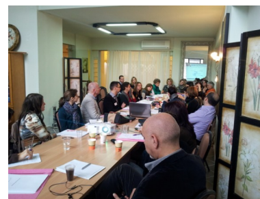
Η αναρτημένη συνάντηση 7-8 Φεβρουαρίου 2013, Ηράκλειο, Κρήτη

Τα δημοσιευμένα στοιχεία από τον Ευρωπαϊκό χώρο είναι ελάχιστα. Περισσότερη έρευνα είναι απαραίτητη προκειμένου να κατανοήσουμε καλύτερα το πρόβλημα.