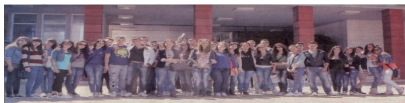
Το έργο COMMUNAID παρουσιάστηκε σε μαθητές λυκείου της πόλης του Ηρακλείου Κρήτης την 25η Απριλίου 2013 κατά τη διάρκεια του προγράμματος ΦΟΙΤΗΤΗΣ-ΓΙΑ-ΜΙΑ-ΗΜΕΡΑ με στόχο την εξοικειωσή τους με τις ακαδημαϊκές δραστηριότητες

Βασικά εμπόδια στην αντιμετώπιση του προβλήματος είναι η ευάλωτη θέση των μεταναστριών, τα κενά στη νομοθεσία, η έλλειψη εξειδικευμένων υπηρεσιών, η ελλιπής συνειδητοποίηση του προβλήματος και οι περιορισμένες δυνατότητες των υπαρχουσών υπηρεσιών