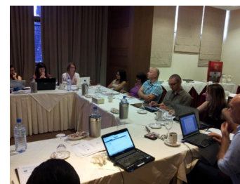
Συνάντηση των εταίρων, 11-12 Ιουλίου 2013, Λεμεσός, Κύπρος

Βασικά εμπόδια στην αντιμετώπιση του προβλήματος είναι η ευάλωτη θέση των μεταναστριών, τα κενά στη νομοθεσία, η έλλειψη εξειδικευμένων υπηρεσιών, η ελλιπής συνειδητοποίηση του προβλήματος και οι περιορισμένες δυνατότητες των υπαρχουσών υπηρεσιών