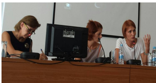
Σεμινάριο στην Λευκωσία, Κύπρος, 28 Σεπτεμβρίου 2014