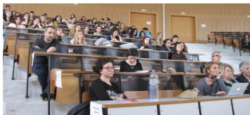
Σεμινάριο στο Ηράκλειο Ελλάδα, 6-7 Νοεμβρίου 2014