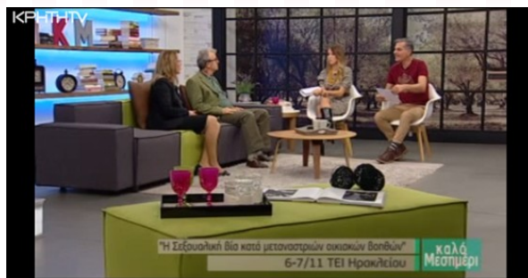
Το COMMUN-AID παρουσιάστηκε σε τηλεοπτικό πρόγραμμα στην Ελλάδα 4 Νοεμβρίου 2014