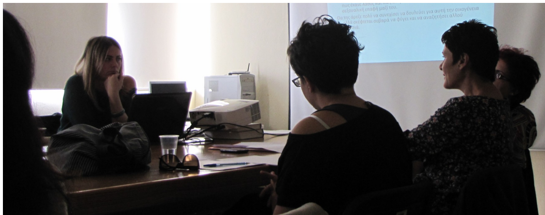
Το πρόγραμμα Εκπαίδευσης Εκπαιδευτή του CommunAid στο Ηράκλειο της Κρήτης, Οκτώβριος 2014

Μέσω της Τεχνικής των Δελφών συντάχθηκε μία ομάδα διεθνών εμπειρογνομόνων εντός των τομέων της σεξουαλικής βίας και της υγείας των μεταναστών προκειμένου να φτάσουν σε συμφωνία σχετικά με τα εκπαιδευτικά στοιχεία της εκπαίδευσης. Το πρόγραμμα Εκπαίδευσης- Εκπαιδευτή εφαρμόστηκε επιτυχώς σε δέκα μέλη τα οποία επιλέχτηκαν από κοινότητες μεταναστών, δημόσιες υπηρεσίες, ΜΚΟ και κοινοτικές ομάδες σε κάθε συνεργαζόμενη χώρα (Ελλάδα, Κύπρος, Σουηδία, Αυστρία και Σλοβενία), με σκοπό να δοκιμαστεί η εφαρμογή, πρακτικότητα και αποτελεσματικότητά του όσον αφορά στην αύξηση της γνώσης και της ικανότητας των συμμετεχόντων. Το εγχειρίδιο Εκπαίδευσης-Εκπαιδευτή είναι διαθέσιμο στις τοπικές γλώσσες των συνεργαζόμενων χωρών και σε κάποιες επικρατέστερες γλώσσες μεταναστών της κάθε συνεργαζόμενη χώρας. Τέλος, το εγχειρίδιο είναι διαθέσιμο μέσω της ιστοσελίδας του προγράμματος ( https://www.teicrete.gr/CommunAid/ ).