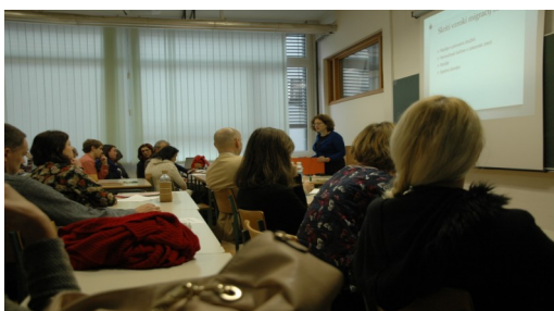
Σεμινάριο στη Λουμπλιάνα Σλοβενία, 4, Δεκεμβρίου 2014

Τα σεμινάρια του COMMUN- παρακολούθησε εύρος φορέων σε κάθε χώρα-εταίρο, περιλαμβάνοντας, σχεδιαστές πολιτικής κυβερνητικά στελέχη, επαγγελματικές οργανώσεις, φορείς προαγωγής της υγείας, εκπαιδευτικές αρχές, ΜΜΕ και το ευρύ κοινό.