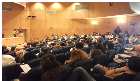
Ημερίδα του COMMUN- AID . Ηράκλειο-Κρήτη 21 Μαρτίου 2014